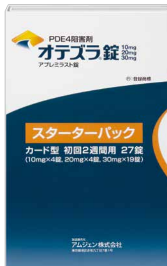
オテズラ錠のスターターパック

飲み始めの6日間は、飲み始めた頃に起きやすい 副作用の発現を防ぐために毎日10mgずつ お薬の量を増やし、6日目以降は30mgを 1日2回、朝と夕方に1錠ずつ服用します。